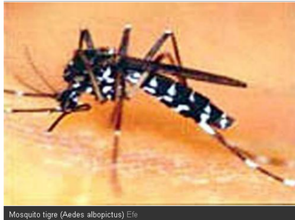
Mosquito tigre ( Aedes albopictus )